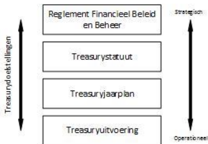
Figuur 1: Treasury bouwwerk

Het Treasurystatuut en het Treasuryjaarplan vormen vervolgens de kaders waarbinnen de uitvoering van alle treasury-activiteiten plaatsvinden.