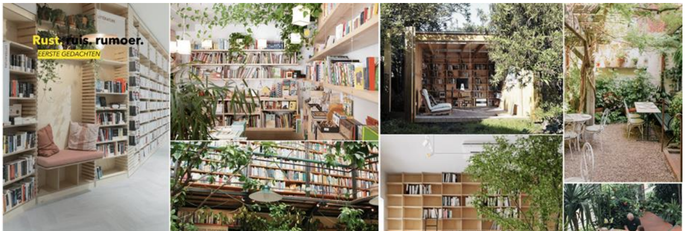
Thema voor de gezamenlijke ruimten: Rust, bruis en rumoer

De aanleunwoningen op het terrein blijven behouden. De woningen worden wel gerenoveerd, maar dat doen we zoveel mogelijk 'bij mutatie', zoals dat heet: als mensen een woning verlaten.